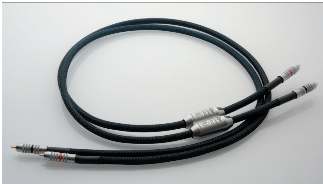
Siltech Crown Princess 訊號線